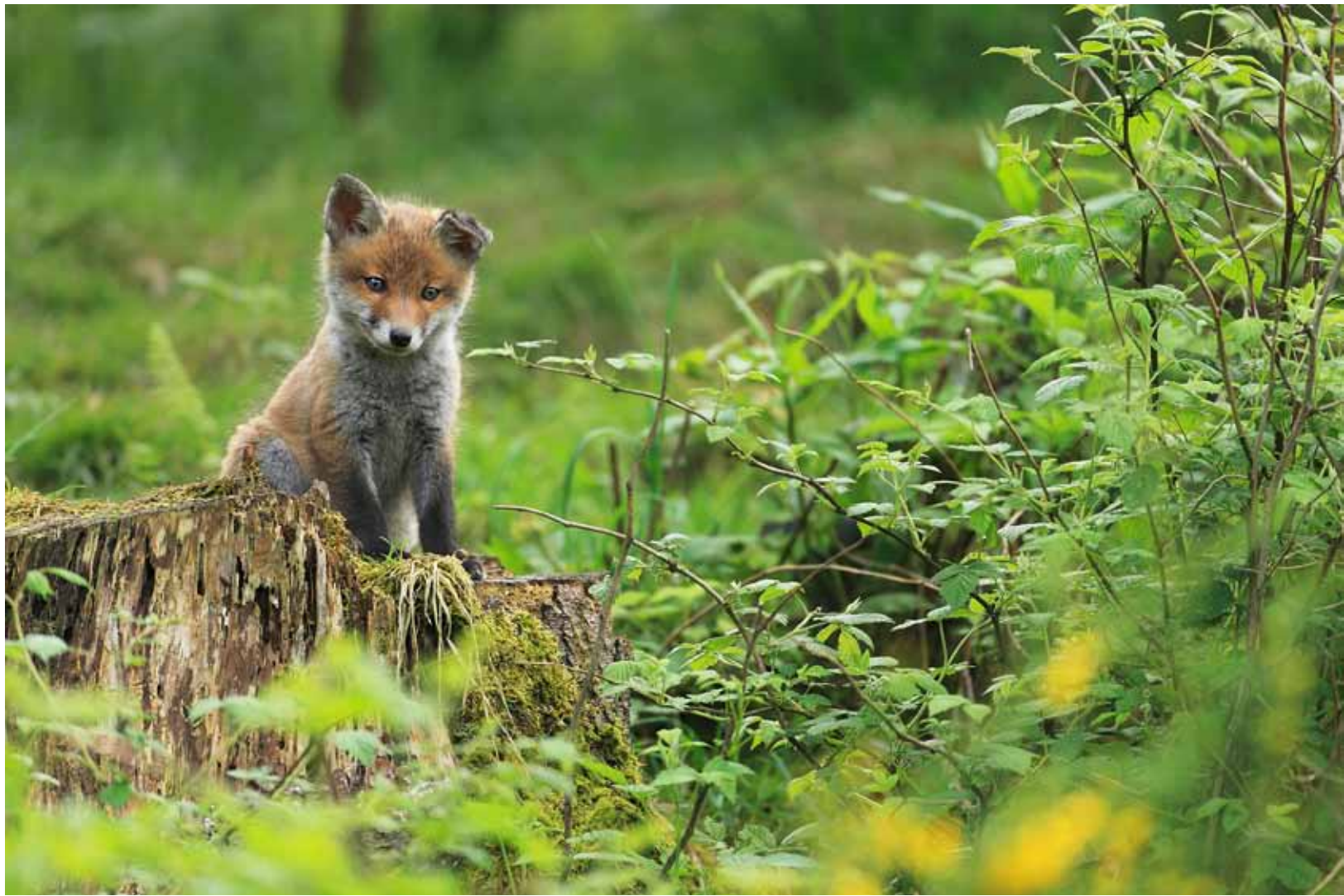
Renard roux et cigognes noires à la pêche. Ces dernières ont fait leur réapparition dans la région dans les années 1990.