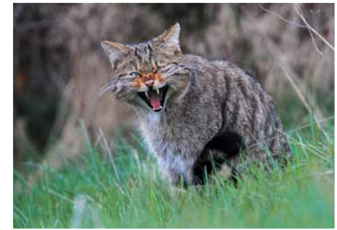
Le chat forestier vit en forêt, mais a aussi besoin de belles prairies pour chasser les rongeurs.

La discrète cigogne noire niche dans la pénombre du couvert forestier.