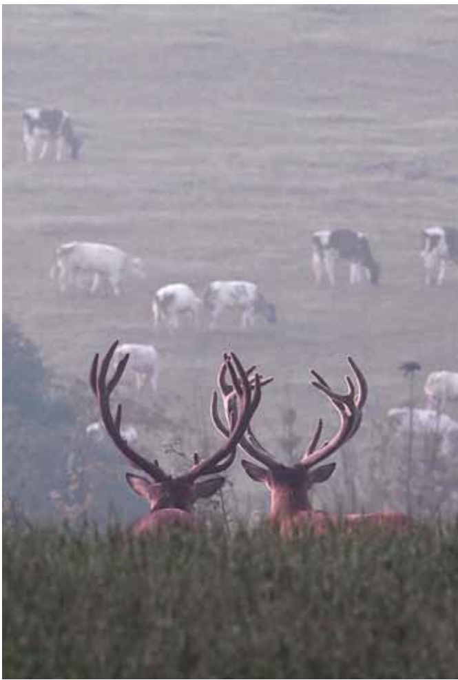
Dans les Ardennes, cerfs élaphe et vaches cohabitent en parfaite harmonie.